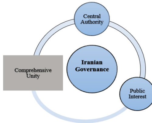
The Tradition of Governance in Iranian Politics

did not tolerate any internal reform. Such a history suggests that one cannot properly reflect on the principles of governance and Iranian politics without considering the legacy of the past. Politics can be understood as the prudent management and organization of public affairs. In the history of Iran, it has rarely occurred that the center enjoyed order and stability while the provinces and regions were in chaos and disorder. This is an important lesson frequently emphasized in ancient Iranian texts. Insisting on authoritarianism does not mean repeating a single model for all eras; rather, the principles of governance or statecraft must be based on the exigencies of the time and modern relations.