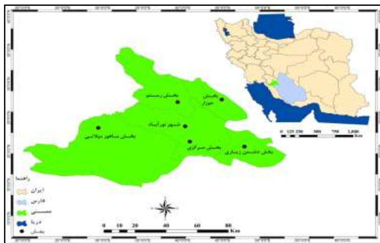
نقشه شماره (۱). موقعیت جغرافیایی شهرستان ممسنی

انتخابات را خواه برای کسب مقام سیاسی، خواه برای به رخ کشیدن ارزش‌ها و ایستار قلمرو طایفه‌ای خود، و خواه برای لذت بردن از فرایند سیاسی، فراهم کرده است. با وجود این، متغیر انتخابات و مشارکت سیاسی، تحت تأثیر عوامل مختلف دیگری نیز قرار دارد و شکاف‌های اجتماعی دیگری نیز در طول دوره‌های گوناگون بر این حوزه انتخابیه تأثیر گذاشته و زمینه شکل‌گیری کارزار انتخاباتی چندشکافی را فراهم می‌کنند.